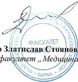
Проф. д-р Златислав Стоянов, д.м.н. Декан на факултет „Медицина“

Уведомлението да се изпрати на посочената от студента електронна поща или да се съобщи по телефона. Ако са неизвестни, уведомлението да се постави на таблото за съобщения в сградата на МУ-Варна и на интернет страницата на университета.